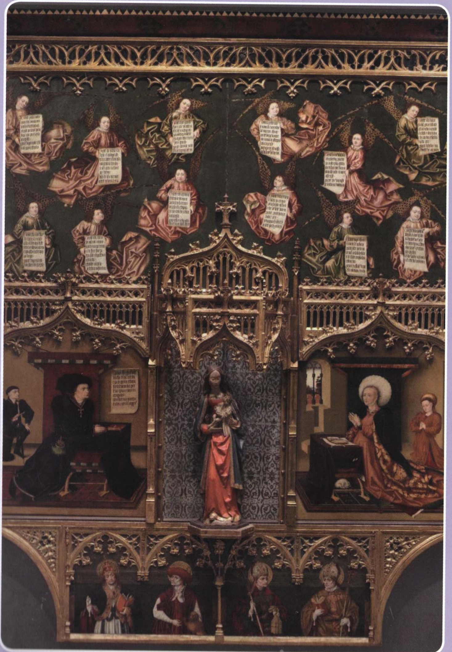
Retablo de los Gozos de Santa María, Jorge Inglés, Doc. 1455. Óleo sobre tabla, 497 x 463 cm, Depositado en el Museo del Prado por don Íñigo de Arteaga, duque del Infantado